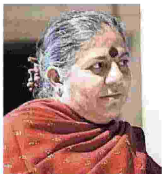
VANDANA SHIVA ATTIVISTA E AMBIENTALISTA INDIANA. DOMANI ORE 21,15, PIAZZA DEL DUOMO