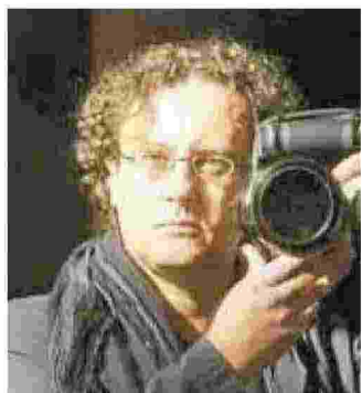
PAOLO PELLEGRIN FOTOGRAFO. CON ROBERTO KOCH "SGUARDI DI CONFINE": OGGI, ORE 15, TEATRO BOLOGNINI